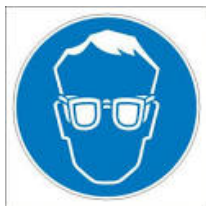
Jól záró védőszemüveg

Jól záródó védőszemüveg az EN 166 szabványnak megfelelő.